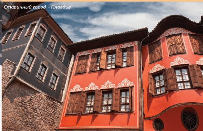
Старинный город - Пловдив

Наша прогулка продолжается в уютный задумчивый мир старинных зданий эпохи болгарского Возрождения, импозантных церквей и притихших монастырей. Часть этих монастырей и церквей удивляют своей архитектурой, другие – своими ценными иконами и росписями, третьи – своим чудатым расположением в живописных укромных уголках Болгарии.