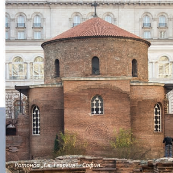
Ротонда „Св. Георгия“ - София

Излюбленными для туристов являются болгарские монастыри и церкви, среди которых выступают Рильский монастырь, Бачковский, Троянский, Роженский, Преображенский, церковь Святой Богородицы в г.Пазарджик, церковь Святой Троицы в горнолыжном курорте Банско и др. Неизгладимым мистическим воспоминанием останутся ваши посещения таинственного мира Аладжа монастыря и Басарбовского монастыря, расположенных прямо в крутых скалах.