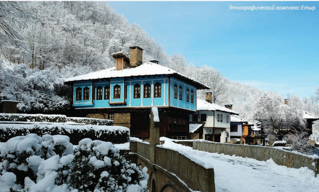
Этнографический комплекс Етыр

Благодаря своему расположению – на юге Европы, Болгария и ее зимние курорты рады изобилию солнца и великолепию снега.