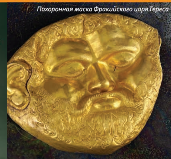
Похоронная маска Фракийского царя Тереса