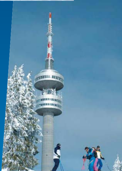
Pico Snezhanka, Pamporovo