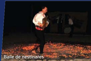
Balle de nestrinares