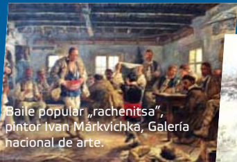
Balle popular „rachenitsa”, pintor Ivan Márkovichka, Galería nacional de arte.