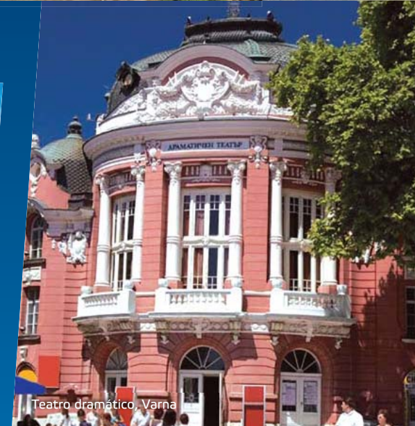
Teatro dramático, Varna

El desarrollo de la economía de mercado en Bulgaria atrae a los inversores extranjeros. El país acoge tradicionales ferias para profesionales y para el público en general, que proporcionan una oportunidad única para las empresas locales y extranjeras para realizar nuevos contactos, ofrecer sus programas y negociar.