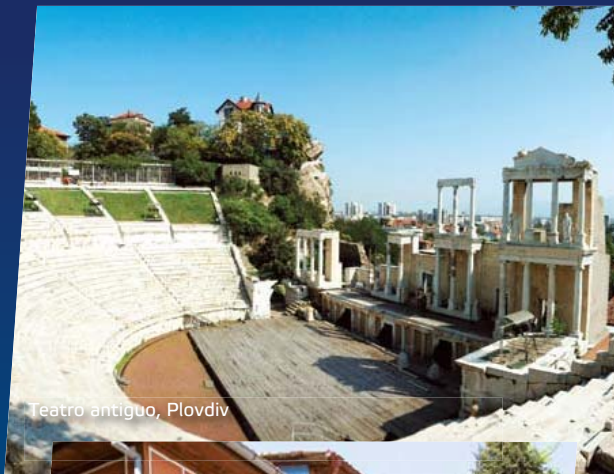
Teatro antiguo, Plovdiv

El antiguo Plovdiv es un organismo urbano singular, vivo, que consiste en yacimientos arqueológicos, museos y galerías con artefactos valiosos, edificios antiguos, templos abiertos al público con decoración de madera tallada pintoresca y rica, cafés acogedores, pintorescas calles empedradas. En 1979 la Ciudad Vieja obtuvo una medalla de oro europea por la protección de los monumentos del pasado.