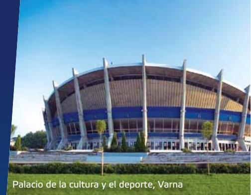
Palacio de la cultura y el deporte, Varna

El complejo cuenta con dos gimnasios equipados con aparatos de entrenamiento modernos. El centro deportivo y de relax está equipado con las instalaciones técnicas necesarias para su total recuperación (saunas, baño de chorros, etc.) y la rehabilitación de los atletas, y también para la electroterapia y fisioterapia. El Palacio de la Cultura y el Deporte también dispone de un gran centro comercial que ofrece oportunidades para el descanso y el tiempo de ocio agradable.