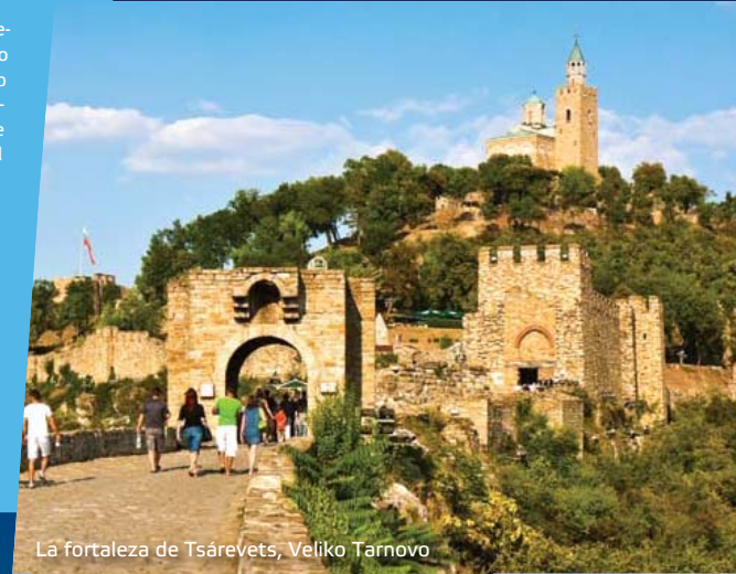
La fortaleza de Tsarevets, Veliko Tarnovo

te de éste durante cinco siglos. La guerra ruso-turca de 1877-1878 dio como resultado la creación del Tercer Estado Búlgaro. Después de la Segunda Guerra Mundial, el país pasó a formar parte del Bloque Oriental y se estableció el régimen comunista. En 1990 en Bulgaria se restauró la democracia bajo la forma de una república parlamentaria y en la actualidad el país es miembro de la Unión Europea y la OTAN. La situación de Bulgaria es especialmente favorable para el transporte. Como parte de Europa del Este, Bulgaria representa una encrucijada y territorio de tránsito entre Europa Occidental, el Oriente Próximo y el Mediterráneo.