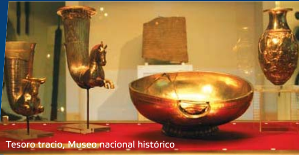
Tesoro tracio, Museo nacional histórico