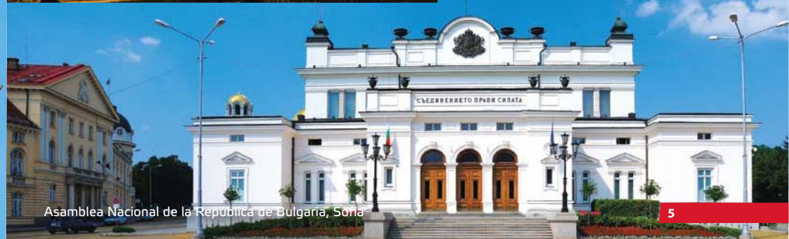
Asamblea Nacional de la República de Bulgaria, Sofía