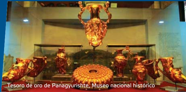
Tesoro de oro de Panagyurishte, Museo nacional histórico