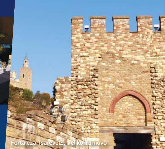
Fortaleza Tsárevets, Veliko Tarnovo