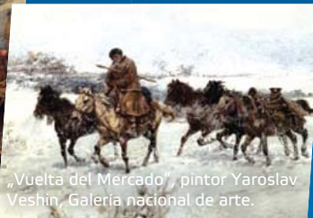
„Vuelta del Mercado”, pintor Yaroslav Veshin, Galería nacional de arte.