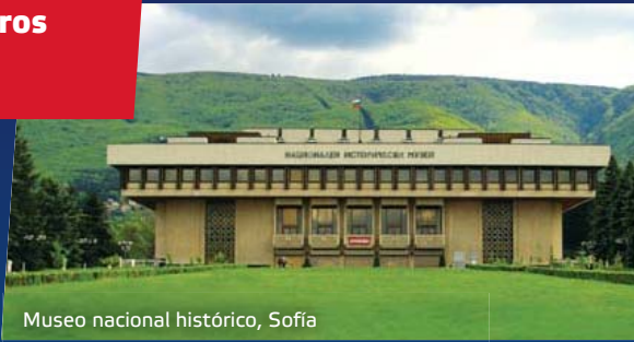
Museo nacional histórico, Sofía

Durante el año tienen lugar numerosos festivales, como los típicos festivales de folklore búlgaro, los de música internacional, de cine y festivales de teatro que atraen a los aficionados de todo el mundo. Entre las fiestas populares más importantes, repletas del espíritu de las costumbres búlgaras y de las tradiciones seculares, están el „Festival de la Rosa” en Kazanlak, el Festival Internacional de Jue-