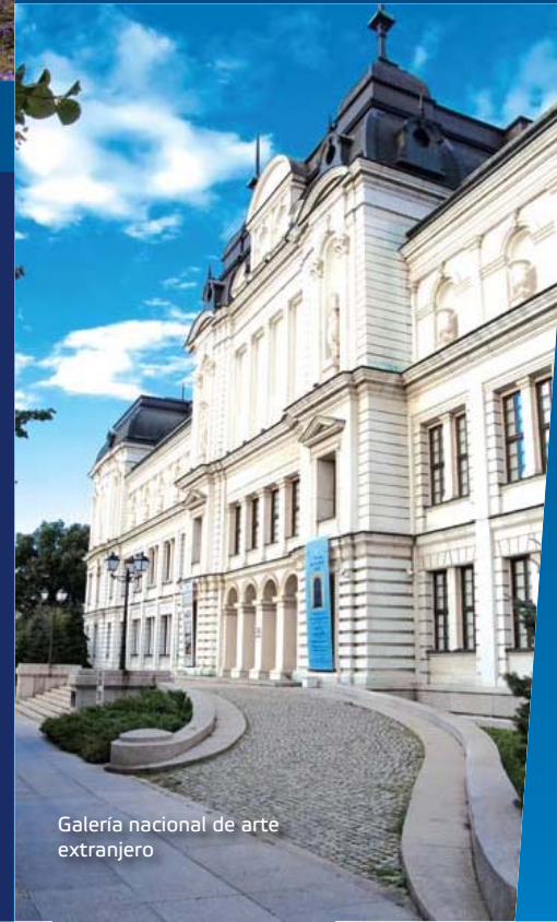
Galería nacional de arte extranjero

Durante su larga historia, la posición geográfica siempre ha sido decisiva para el desarrollo de este país. Desde su fundación en el año 681, Bulgaria se convirtió en uno de los centros más importantes de Europa. Desempeñó un papel muy importante en la difusión de la cultura cristiana entre los pueblos de Europa del Este. Varios siglos más tarde, con el decaimiento del Segundo Imperio Búlgaro (1185-1396), el país fue conquistado por el Imperio Otomano y siguió formando par-