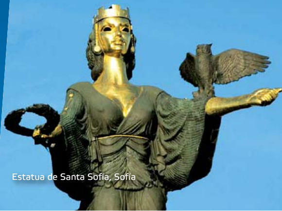
Estatua de Santa Sofía, Sofía

La ciudad tiene una historia de 7.000 años. En el s. VIII a. C. en el lugar de un asentamiento neolítico surgió la antigua ciudad tracia de Sérdica, escogida por su ubicación estratégica y sus recursos naturales.