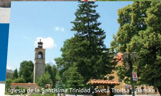
Iglesia de la Santísima Trinidad „Svetá Troitsa”, Bansko