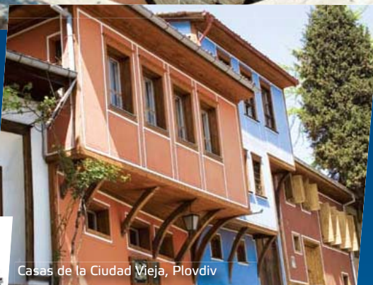
Casas de la Ciudad Vieja, Plovdiv