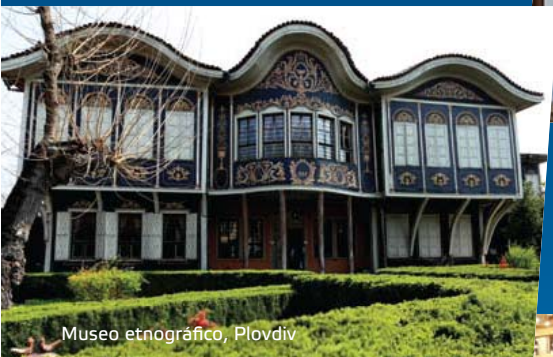
Museo etnográfico, Plovdiv