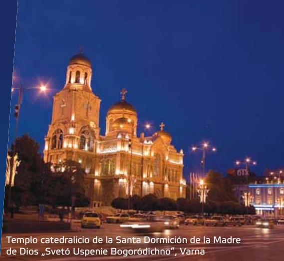
Templo catedralicio de la Santa Dormición de la Madre de Dios „Svetó Uspenie Bogoródichno”, Varna

Situado en el lugar más atractivo en el mismo centro, inmediatamente a la entrada principal del Jardín marítimo y a 100 m de la playa, el Centro de Festivales y Congresos de Varna es uno de los símbolos de la ciudad, centro cultu-