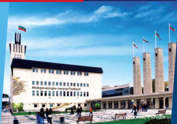
Feria internacional, Plovdiv

El turismo de negocios en Bulgaria se desarrolla en instalaciones modernas que le ayudarán a entrar con éxito y de manera adecuada en el mercado búlgaro. Para ello contribuyen muchos centros de exposiciones y conferencias, salas de conferencias, iniciativas de exposiciones y festivales, dispersos por todas las regiones del país.