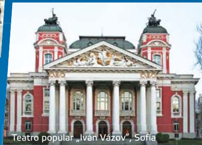
Teatro popular „Iván Vázov”, Sofía