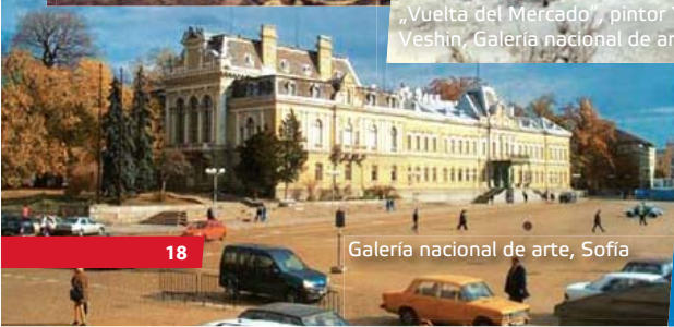
Galería nacional de arte, Sofía