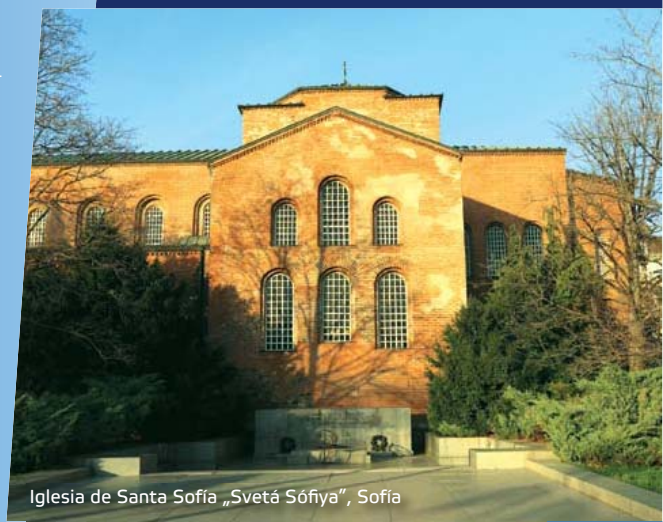
Iglesia de Santa Sofía „Svetá Sôfiya“, Sofía

La ciudad recibió su nombre actual en la Edad Media inspirándose en el templo de Santa Sofía „Svetá Sôfiya“. Junto a la capital se halla la singular Iglesia de Boyana „Boyanska tsarkva“ de la lista de Patrimonio de la Humanidad de la UNESCO. En Sofía se hallan el templo catedralicio de San Alejandro Nevski „Sveti Aleksandar Nevski“, el Museo Nacional Histórico, la iglesia rusa de San Nicolás „Sveti Nikolay“, el Teatro Nacional „Iván Vázov“, la Galería Nacional de Arte, etc.