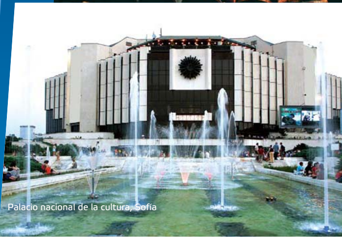
Palacio nacional de la cultura, Sofía

Inter Expo y Centro de Congresos dispone de una de las salas de conferencias más grandes en Bulgaria. Situado en la parte sureste de Sofía, a 3 km del aeropuerto internacional y a 6 km del centro de la ciudad, en sus salas, con una superficie total de 42.000 m2 se celebran una serie de eventos nacionales e internacionales.