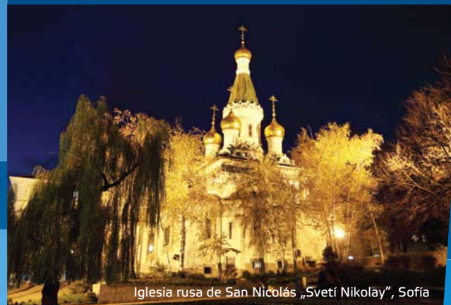
Iglesia rusa de San Nicolás „Sveti Nikolay“, Sofía

Para este fin, posee una amplia selección de salas con diferentes capacidades en prestigiosos hoteles de cuatro y cinco estrellas, algunos de los cuales son representantes de cadenas conocidas en todo el mundo. Dependiendo del acontecimiento, le proporcionarán salas cómodas y acogedoras - con sistemas de sonorización, multimedia, aire acondicionado, pantallas, capacidad para traducciones, o, en una palabra, todo lo necesario para un perfecto evento de negocios.