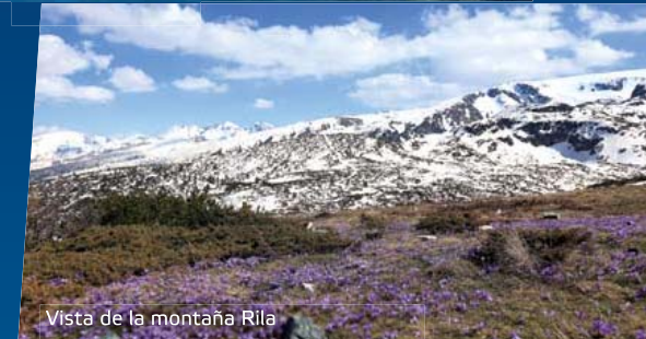
Vista de la montaña Rila

te de éste durante cinco siglos. La guerra ruso-turca de 1877-1878 dio como resultado la creación del Tercer Estado Búlgaro. Después de la Segunda Guerra Mundial, el país pasó a formar parte del Bloque Oriental y se estableció el régimen comunista. En 1990 en Bulgaria se restauró la democracia bajo la forma de una república parlamentaria y en la actualidad el país es miembro de la Unión Europea y la OTAN. La situación de Bulgaria es especialmente favorable para el transporte. Como parte de Europa del Este, Bulgaria representa una encrucijada y territorio de tránsito entre Europa Occidental, el Oriente Próximo y el Mediterráneo.