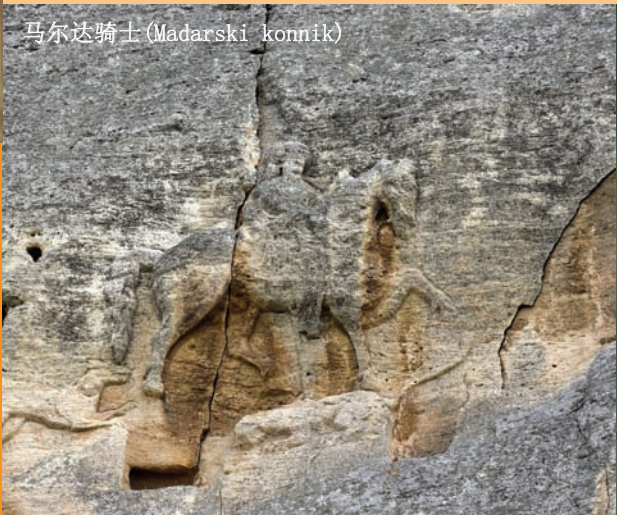
马达尔骑士 (Maderski konnik)