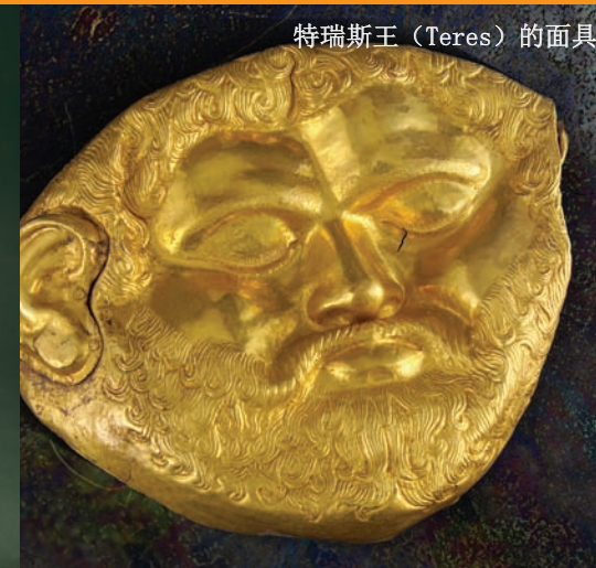
特瑞斯王 (Teres) 的面具

古老的色雷斯人民和他们的宝藏！跟生活在2000多年前的色雷斯人的神奇相遇。这里最著名的发现就是帕纳久里什泰 (Panagyrskoto)，罗郭真斯 (Rogozenskoto)，瓦阿勒奇特 (Valchitranskoto) 和勒特尼斯口 (Letnishko) 的宝藏。你一定会惊讶于博罗沃 (Borovo) 牛角杯的优雅和美丽。欧洲最古老的手工抛光金器就是在瓦尔纳墓地 (Varna) 发现的，距今已有6000多年的历史。