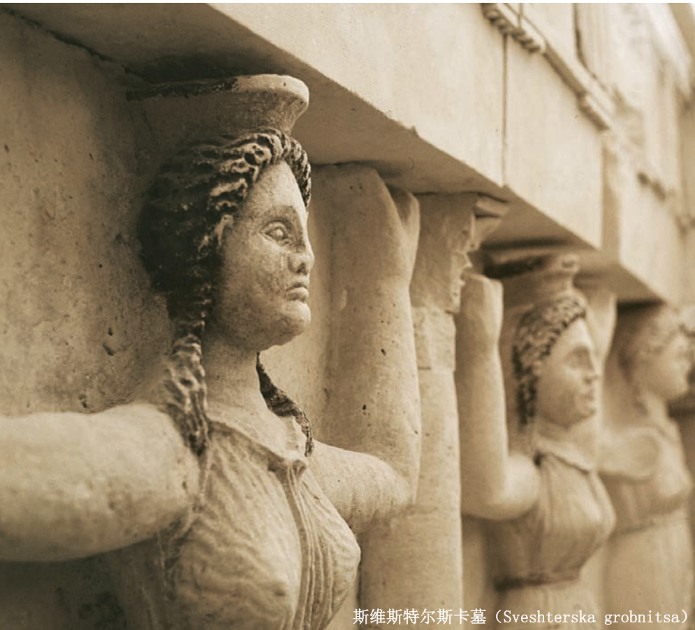
斯维斯特尔斯卡墓 (Sveshterska grobnitsa)