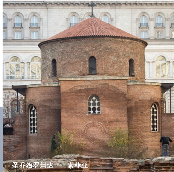
圣乔治坦达 - 索非亚

保加利亚的教堂和修道院是令人着迷的杰作诸如：里拉 (Rilski)，巴奇科夫 (Bachkovski)，特罗扬 (Troyanski)，罗真 (Rojenski)，佩罗巴金斯奇 (Preobrajenski) 修道院，在帕扎尔吉克 (Pazardzik) 的圣母 (Bogoroditsa) 教堂，还有在班斯科的三一神 (Troitsa) 等等。拜访阿拉扎 (Aladja) 修道院或者是贝萨尔波沃斯奇 (Besarbovski) 修道院的神秘世界，将会是你整个旅途中独特的体验