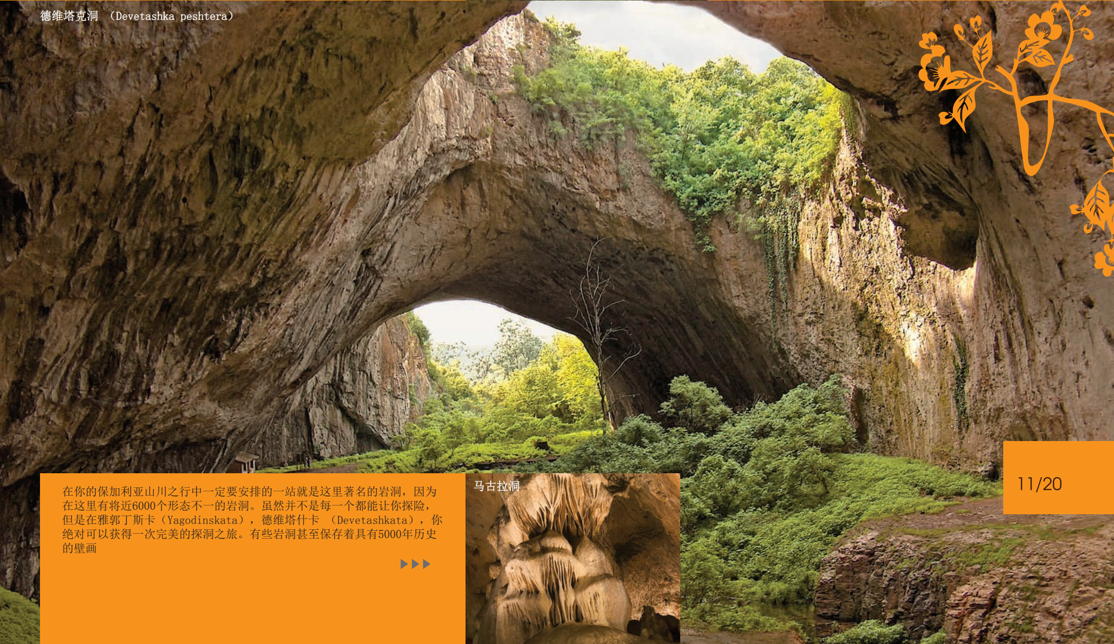
德维塔克洞 (Devetashka peshtera)

在你的保加利亚山川之行中一定要安排一站就是这里著名的岩洞, 因为在这里有将近6000个形态不一的岩洞。虽然并不是每一个都能让你探险, 但是在雅郭丁斯卡 (Yagodinskata), 德维塔什卡 (Devetashkata), 你绝对可以获得一次完美的探洞之旅。有些岩洞甚至保存着具有5000年历史的壁画