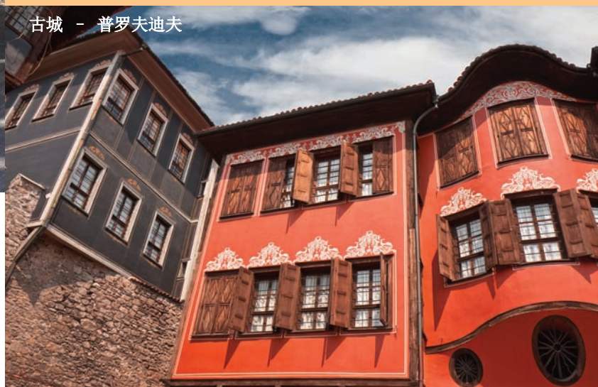
古城 - 普罗夫迪夫

我们的旅行继续前行，沿途你会看到安逸而充满着记忆的文艺复兴时期的老房子，具有独特魅力的教堂，和安静的修道院。这些教堂和修道院，有的以它独一无二的建筑风格而著称，有的以它的技艺高超的壁画及圣像而让人印象深刻，还有的以它坐落的美丽地理位置而让人流连忘返。