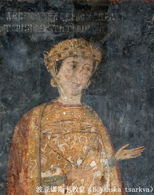
波亚诺斯卡教堂 (Boyanska tsarkva)

▲ 保加利亚古都！普利斯卡 (Pliska)，普雷斯拉夫 (Veliki Preslav)，大特尔诺沃 (Veliko Tranovo) ... 是保加利亚帝国昔日辉煌的见证，文化的顶峰、民族的自信。宫殿，幕墙，长形基督教堂... 聚集着经过时间洗礼的财富和智慧。