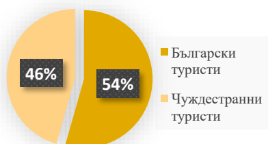
Структура на регистрациите януари - юни 2019 г.