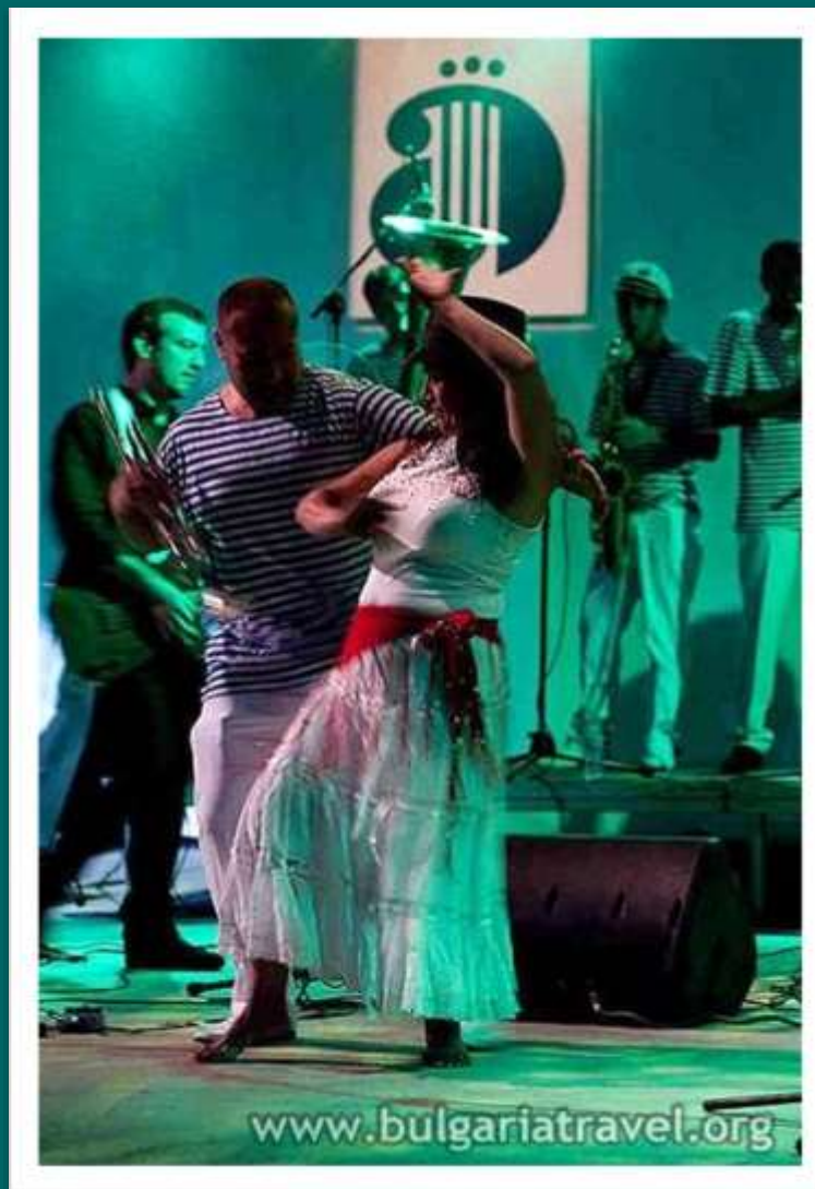
Празници на изкуствата „Аполония“