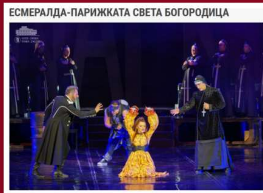
26.08. 21 часа, сцена на хълма Царевец, Велико Търново