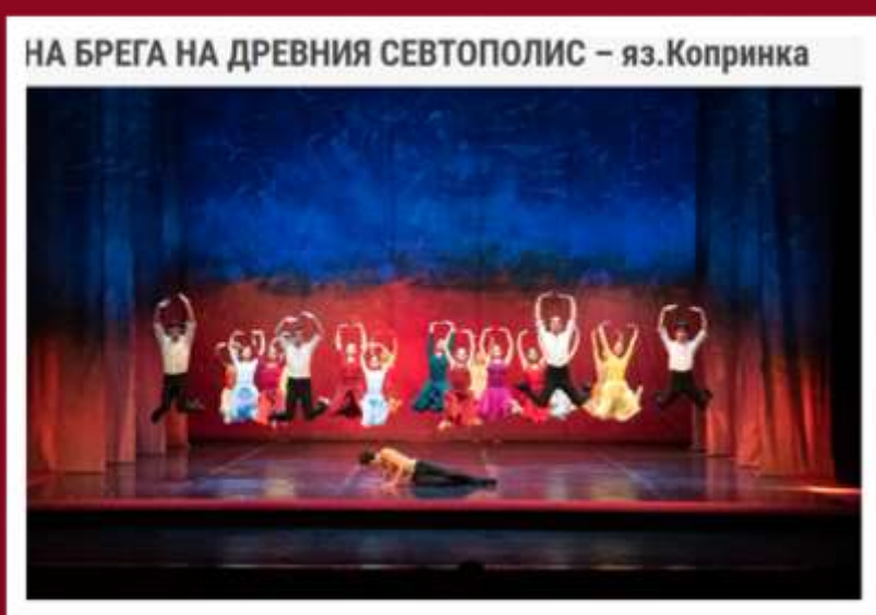
30.08., Язовир Копринка, Казанлък