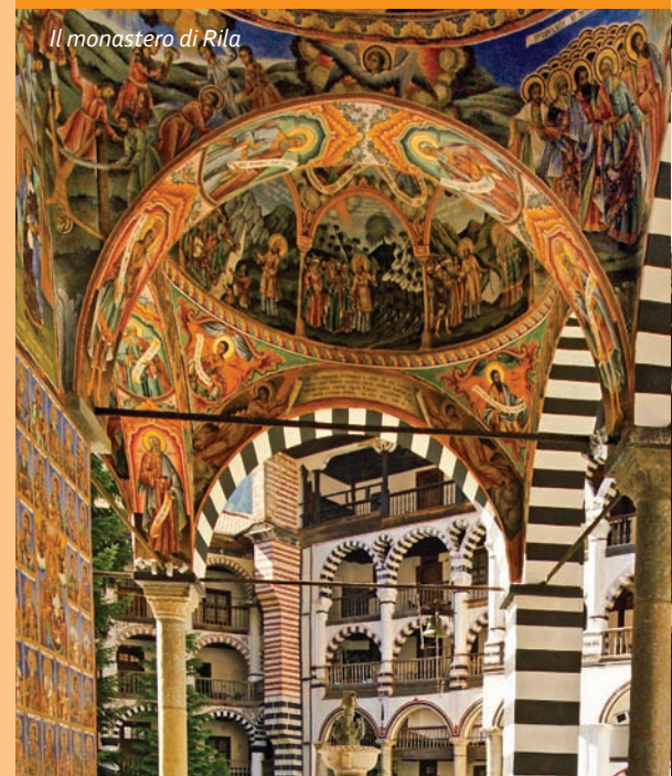
Il monastero di Rila

I monasteri e le chiese bulgare sono celebri, tra i quali il monastero di Rila, Bachkovo, Troyan, Rozhen, Preobrazhenski, la chiesa "Sv. Bogoroditza" /"Madonna Santissima"/ a Pazardzhik, la chiesa "Sv. Troitza" /"Santa Trinità"/ a Bansko e altri. I vostri incontri con il mondo misterioso del monastero di Aladzha o Bessarabovo potranno essere un tratto interessante della vostra vacanza.