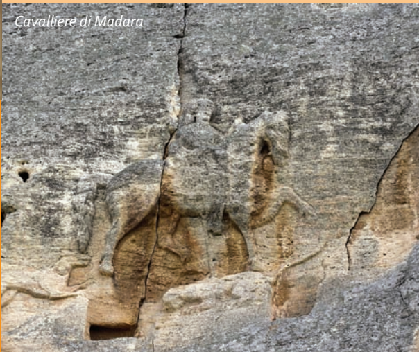
Cavaliere di Madara

Gli antichi traci e i loro tesori! Un incontro affascinante con il raffinato stile di vita di una popolazione vissuta più di duemila e cinquecento anni fa. I più famosi sono quelli di Panagyurishte, Rogozen, Valchitran e Letnitsa. Colpiscono per la loro finezza i rhyton di Borovo! E il più antico oro lavorato in Europa è stato trovato nella necropoli di Varna: ha più di 6000 anni.