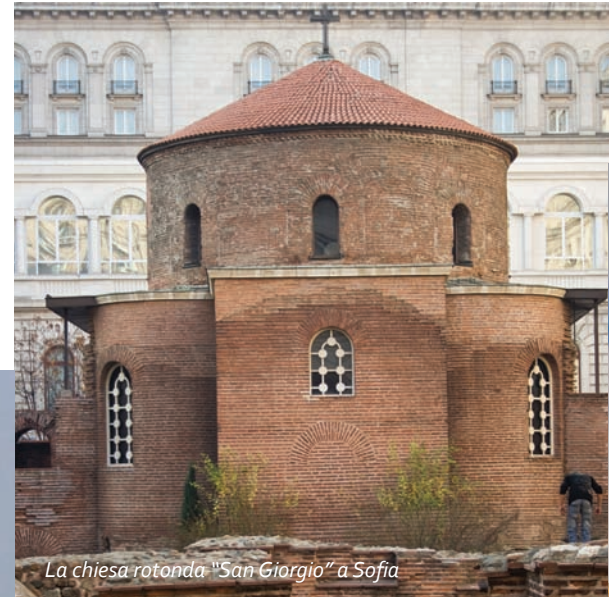
La chiesa rotonda "San Giorgio" a Sofia

I monasteri e le chiese bulgare sono celebri, tra i quali il monastero di Rila, Bachkovo, Troyan, Rozhen, Preobrazhenski, la chiesa "Sv. Bogoroditza" /"Madonna Santissima"/ a Pazardzhik, la chiesa "Sv. Troitza" /"Santa Trinità"/ a Bansko e altri. I vostri incontri con il mondo misterioso del monastero di Aladzha o Bessarabovo potranno essere un tratto interessante della vostra vacanza.