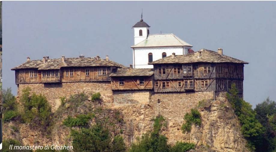
Il monastero di Glazhen

La nostra passeggiata mozzafiato continua tra l'accoglienza e il mondo immerso nei pensieri delle antiche case del Risorgimento bulgaro, belle chiese e silenziosi monasteri. Alcuni monasteri e chiese impressionano per la loro architettura unica, altri – per le preziose icone e affreschi fatti con maestria, e i terzi – per la loro disposizione nei luoghi più pittoreschi della Bulgaria.