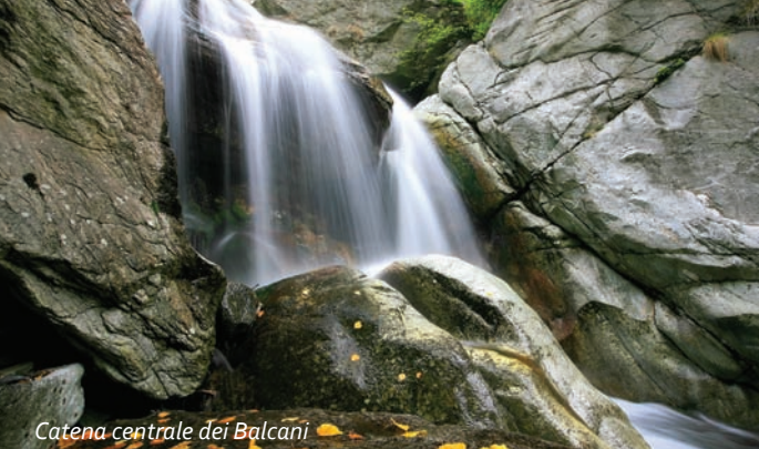
Catena centrale dei Balcani

Bulgaria è famosa per le sue 600 sorgenti termali. Il suo vantaggio principale è che le risorse bioclimatiche e balneologiche si trovano in combinazioni raramente incontrate, famose come l'unione tra la montagna e il mare. L'armonia tra le bellezze naturali e i moderni centri SPA, trasformano la Bulgaria in una ricercata destinazione SPA.