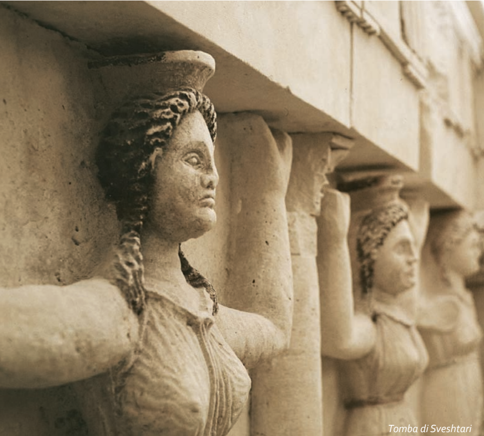
Tomba di Sveshtari