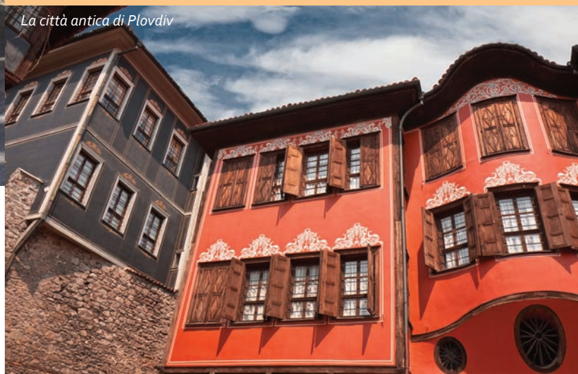
La città antica di Plovdiv

La nostra passeggiata mozzafiato continua tra l'accoglienza e il mondo immerso nei pensieri delle antiche case del Risorgimento bulgaro, belle chiese e silenziosi monasteri. Alcuni monasteri e chiese impressionano per la loro architettura unica, altri – per le preziose icone e affreschi fatti con maestria, e i terzi – per la loro disposizione nei luoghi più pittoreschi della Bulgaria.