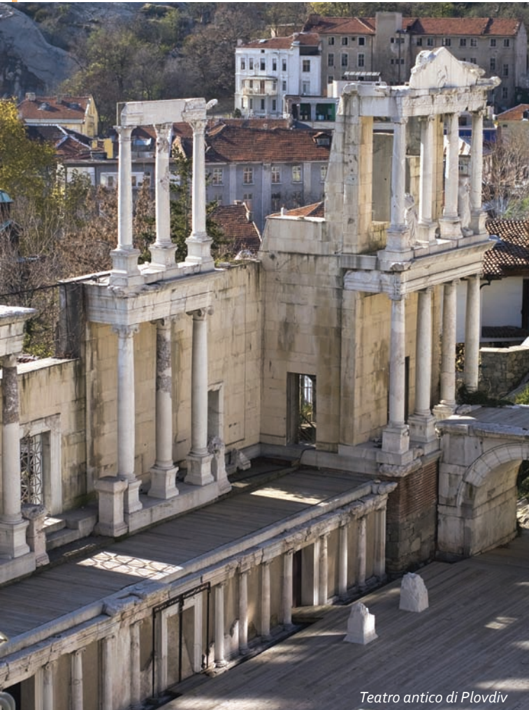
Teatro antico di Plovdiv