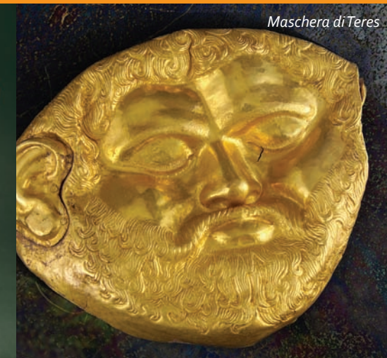
Maschera di Teres