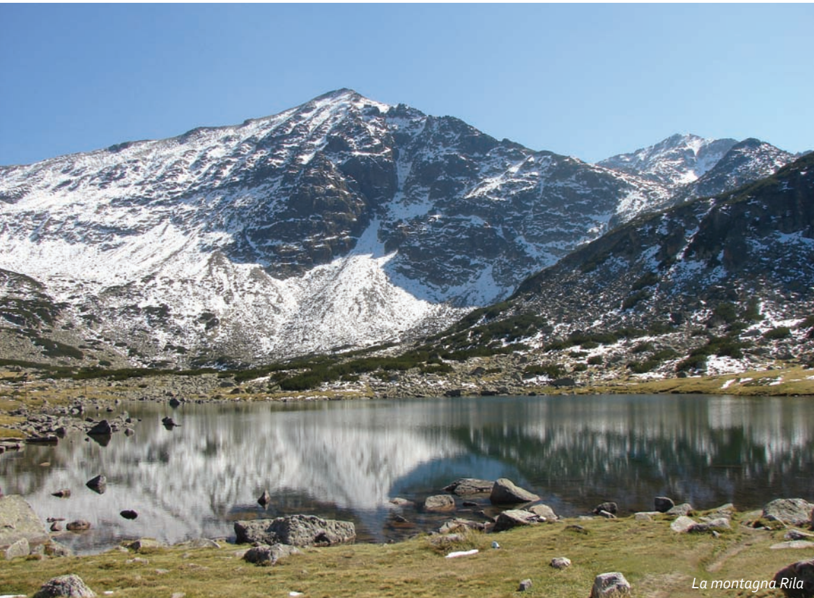
La montagna Rila