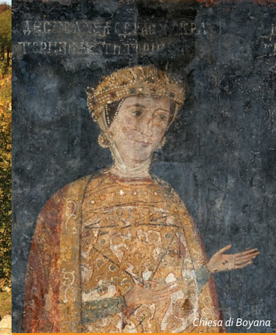
Chiesa di Boyana

Le nuove clamorose scoperte archeologiche della Bulgaria! Perperikon – il tempio di Dionisio, famoso nell'antichità; Starosel – il tempio-tomba più grande del Sudest Europa, oppure l'incredibile maschera – phiale d'oro del re degli Odrisi, Teres... Gli splendidi ritratti del tumulo Ostrusha e Tatul – il santuario, dove si offrivano i sacrifici alle antiche divinità dei traci. E adesso anche la clamorosa scoperta delle reliquie di San Giovanni Battista all'isola San Giovanni, vicino a Sozopol.