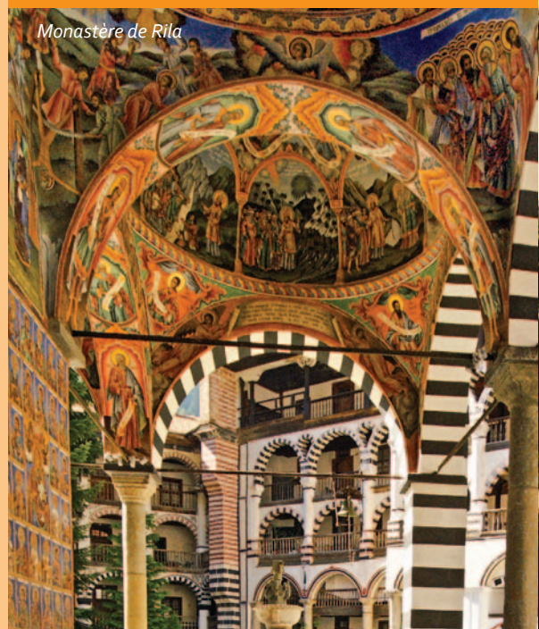
Monastère de Rila

Les monastères et les églises bulgares sont remarquables - le monastère de Rila, le monastère de Bachkovo, de Troyan et de Rozhen, le monastère de la Transfiguration, l'église de St. Vierge Marie à Pazardzhik, l'église de Saint-Trinité à Bansko etc. Vos rencontres avec le monde mystérieux d'Aladja monastère ou avec le monastère Besarbovski donneront une touche particulière à vos vacances.