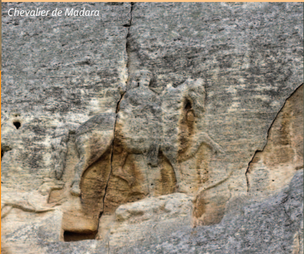
Chevalier de Madara