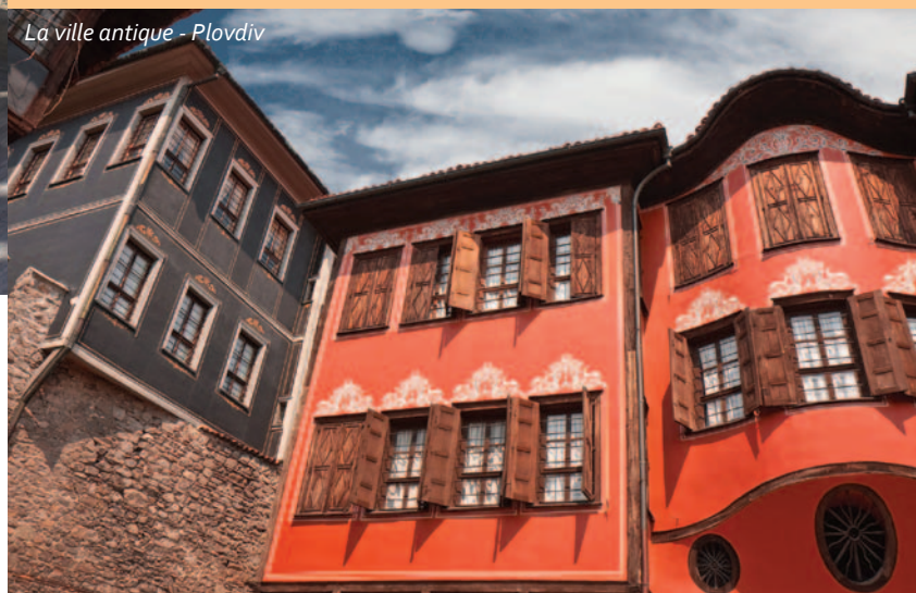
La ville antique - Plovdiv

Notre promenade continue dans l'ambiance conviviale et dans le monde pensif des maisons anciennes de l'époque de la Renaissance, des belles églises et des monastères silencieux. Certains monastères et églises impressionnent les visiteurs par leur architecture unique, d'autres - par leurs icônes de valeur et leurs fresques de grands maîtres, et d'autres encore - par leur emplacement dans les endroits les plus pittoresques de la Bulgarie.