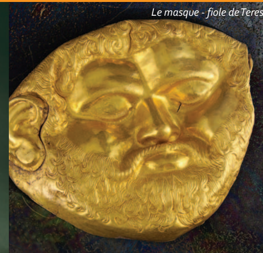
Le masque - fiole de Teres

Les anciens Thraces et leurs trésors! Une rencontre excitante avec le mode de vie sophistiqué de personnes qui ont vécu il y a plus de deux millénaires et demi. Les trésors les plus populaires sont ceux de Panagyurishte, de Rogozen, de Valchitran et de Letnitsa. Vous serez stupéfaits du trésor de Borovo! On a trouvé en Bulgarie dans la nécropole de Varna le plus ancien or traité en Europe qui date de plus de 6000 ans.