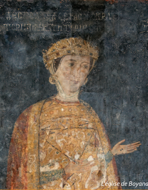
L'église de Boyana

Les dernières sensations archéologiques de la Bulgarie! Perperikon - le sanctuaire du dieu Dionysos, célèbre dans l'antiquité, Starosel - le plus grand temple-tombeu thrace en Europe du Sud-Est et l'incroyable masque-fiole d'or du roi Odrysiyan - Teres ... Les merveilleux portraits du tumulus de Ostrusha et le sanctuaire de Tatul où les Thraces transféraient des victimes aux anciens dieux. Et maintenant la découverte sensationnelle des reliques de Saint Jean-Baptiste sur l'île de Saint-Ivan près de Sozopol.