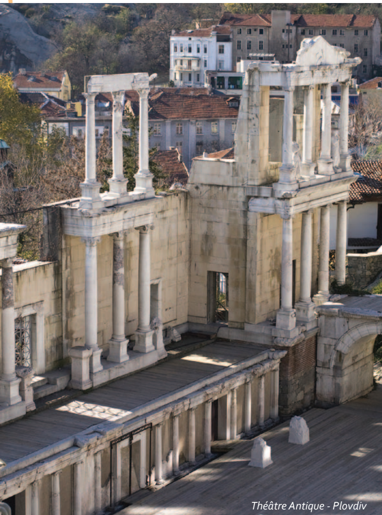
Théâtre Antique - Plovdiv