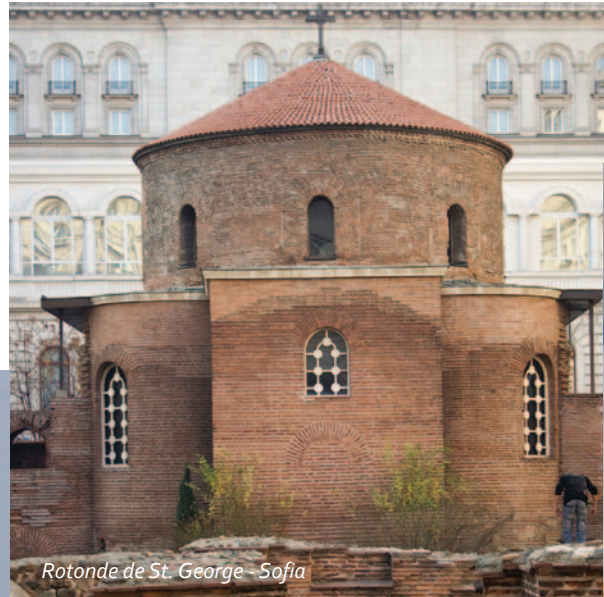
Rotonde de St. George - Sofia

Les monastères et les églises bulgares sont remarquables - le monastère de Rila, le monastère de Bachkovo, de Troyan et de Rozhen, le monastère de la Transfiguration, l'église de St. Vierge Marie à Pazardzhik, l'église de Saint-Trinité à Bansko etc. Vos rencontres avec le monde mystérieux d'Aladja monastère ou avec le monastère Besarbovski donneront une touche particulière à vos vacances.