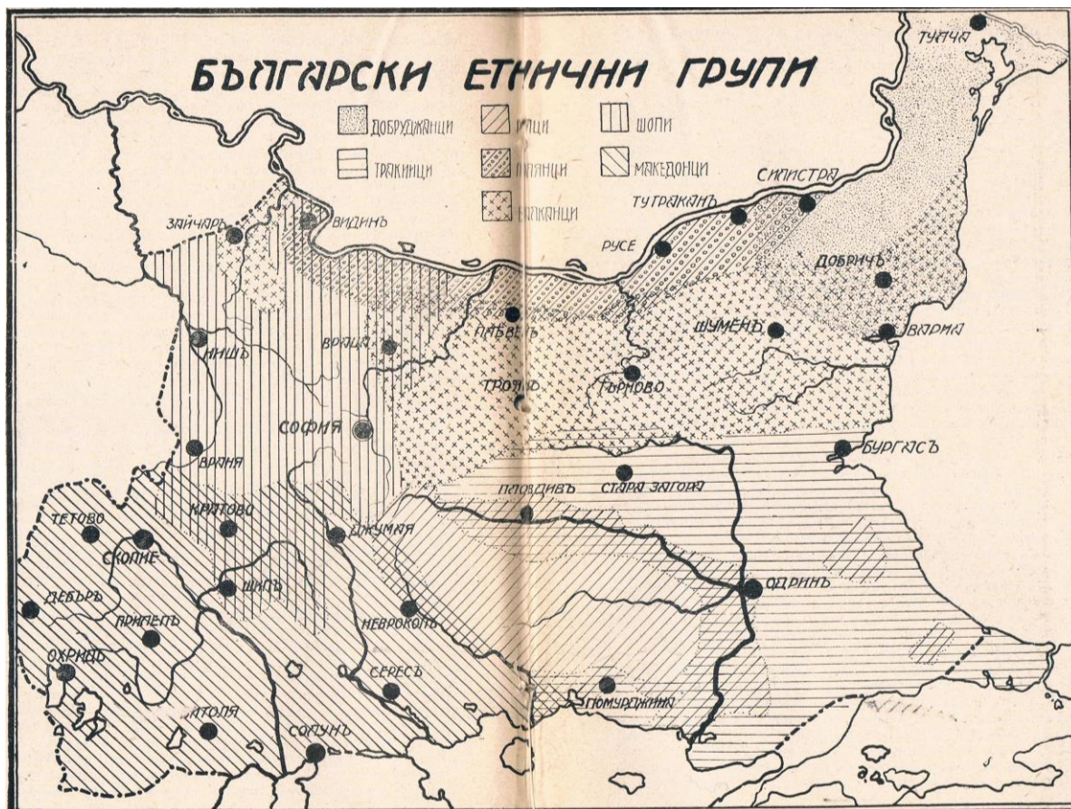
Фиг. 1 Етнически групи в териториалния обхват на България към началото на 40-те години на XX в. (Вакарелски, 1943)

Това райониране може да послужи като ориентир при очертаването на туристическите райони, доколкото етнографските особености са трудно податлив на